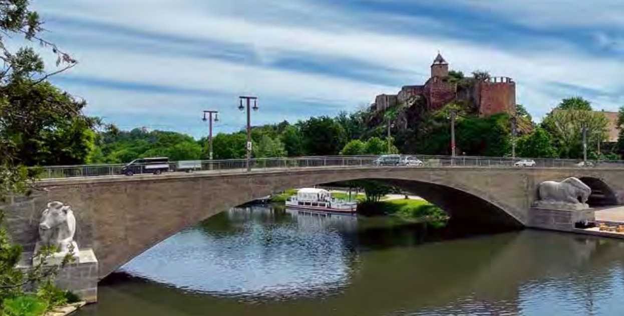
Blick auf die Burg Giebichenstein und die Kröllwitzer Brücke mit den Tierfiguren nach Entwürfen des Künstlers Gerhard Marcks.