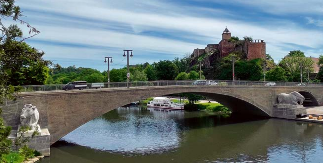
Blick auf die Burg Giebichenstein und die Kröllwitzer Brücke mit den Tierfiguren nach Entwürfen des Künstlers Gerhard Marcks.